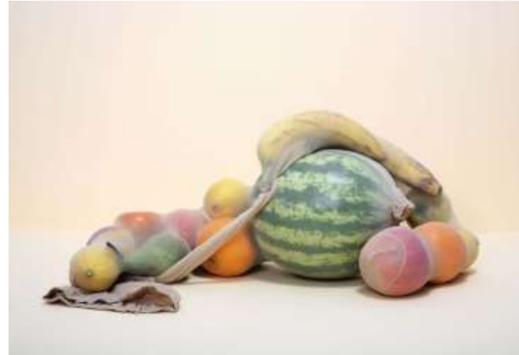
Krista van der Niet: uitgesproken geil stilleven met fruit [FOAM “Still/Life”]