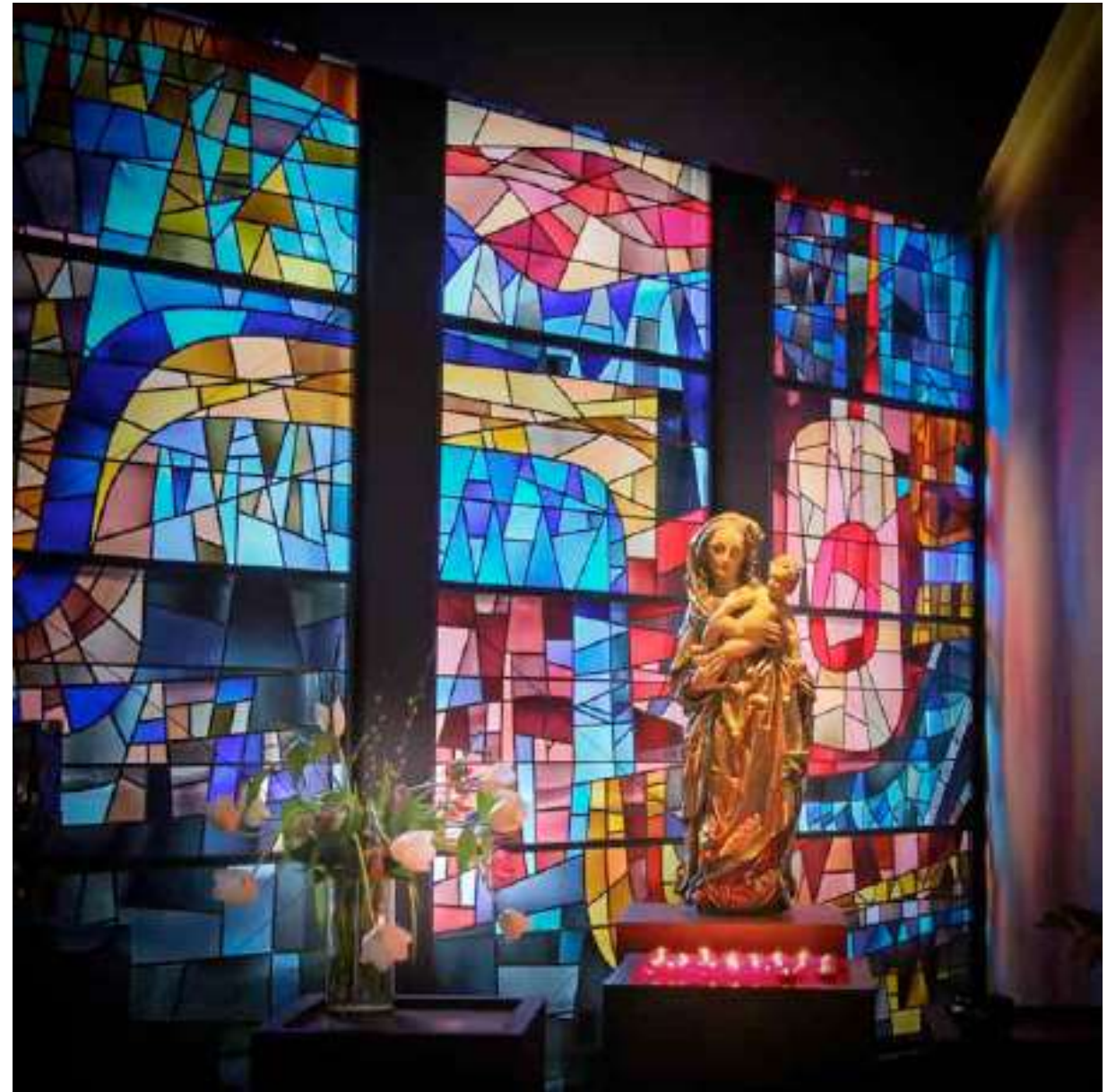
een eigen stilleven