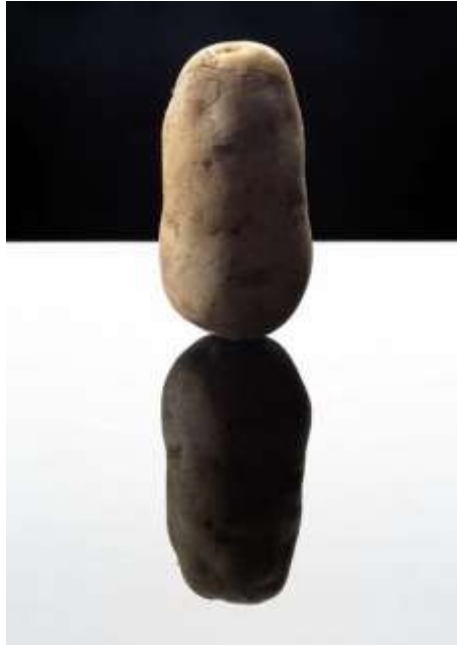
Anuschka Blommers en Niels Schumm: The potatoes series [FOAM “Still/Life”]