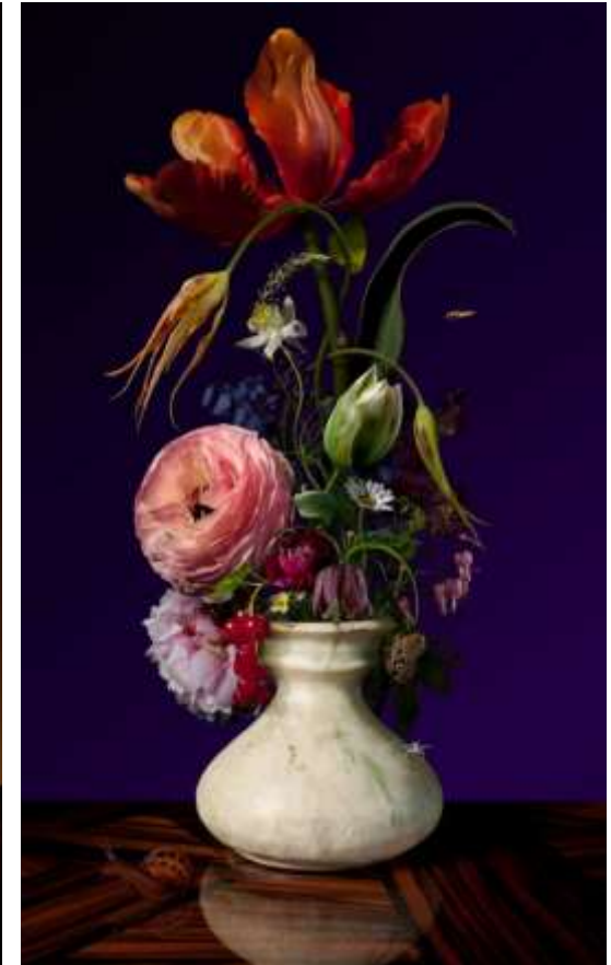
Over Bas Meeuws (fotograaf van stillevens) bloem voor bloem