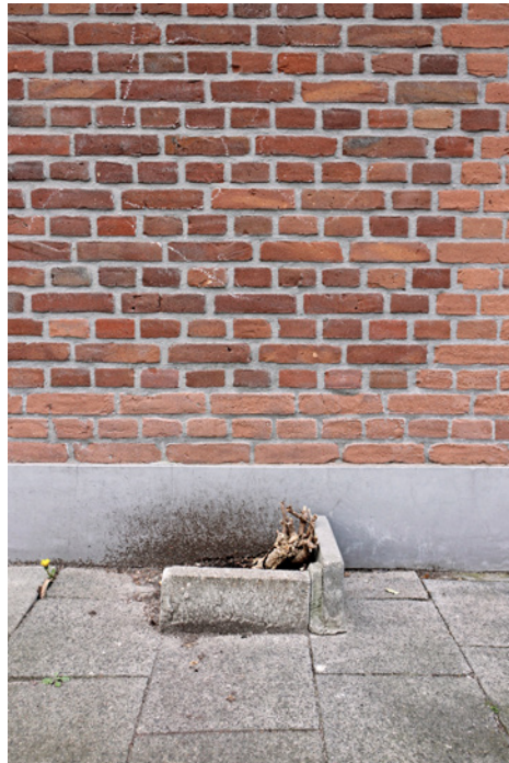
Margriet van Vianen — Taxonomie

Aan het eind van de Masterclass selecteren de curatoren met de docenten maximaal 10 projecten die deel uit gaan maken van de expositie 'Masterclass' van BredaPhoto 2018. Met hen wordt een extra cursusdag ingepland om de presentatie van hun werk voor te bereiden. Hun expositie is te zien tijdens de 8e editie van BredaPhoto van 5 september tot en met 21 oktober 2018. We vragen aan de fotografen die worden geselecteerd voor de expositie een productiebijdrage van € 150,-. Na het festival worden de geëxposeerde werken eigendom van de fotograaf.