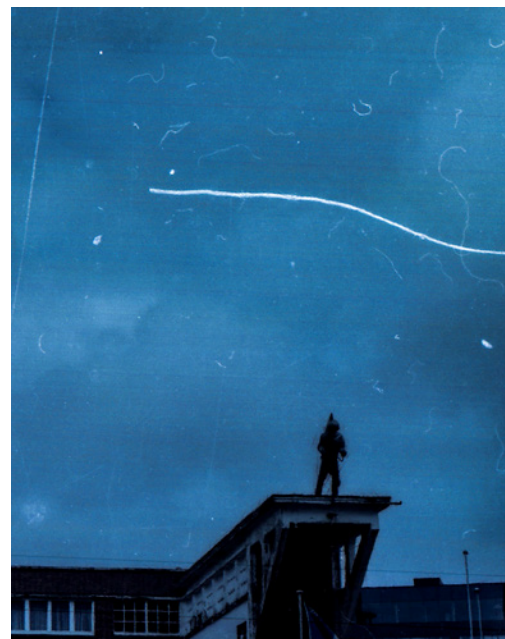
Nathalie Visser — Space to Dream